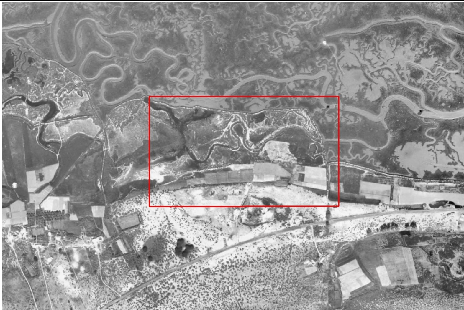
Ortofoto del vuelo nacional de 1985, zona de estudio en recuadro rojo.