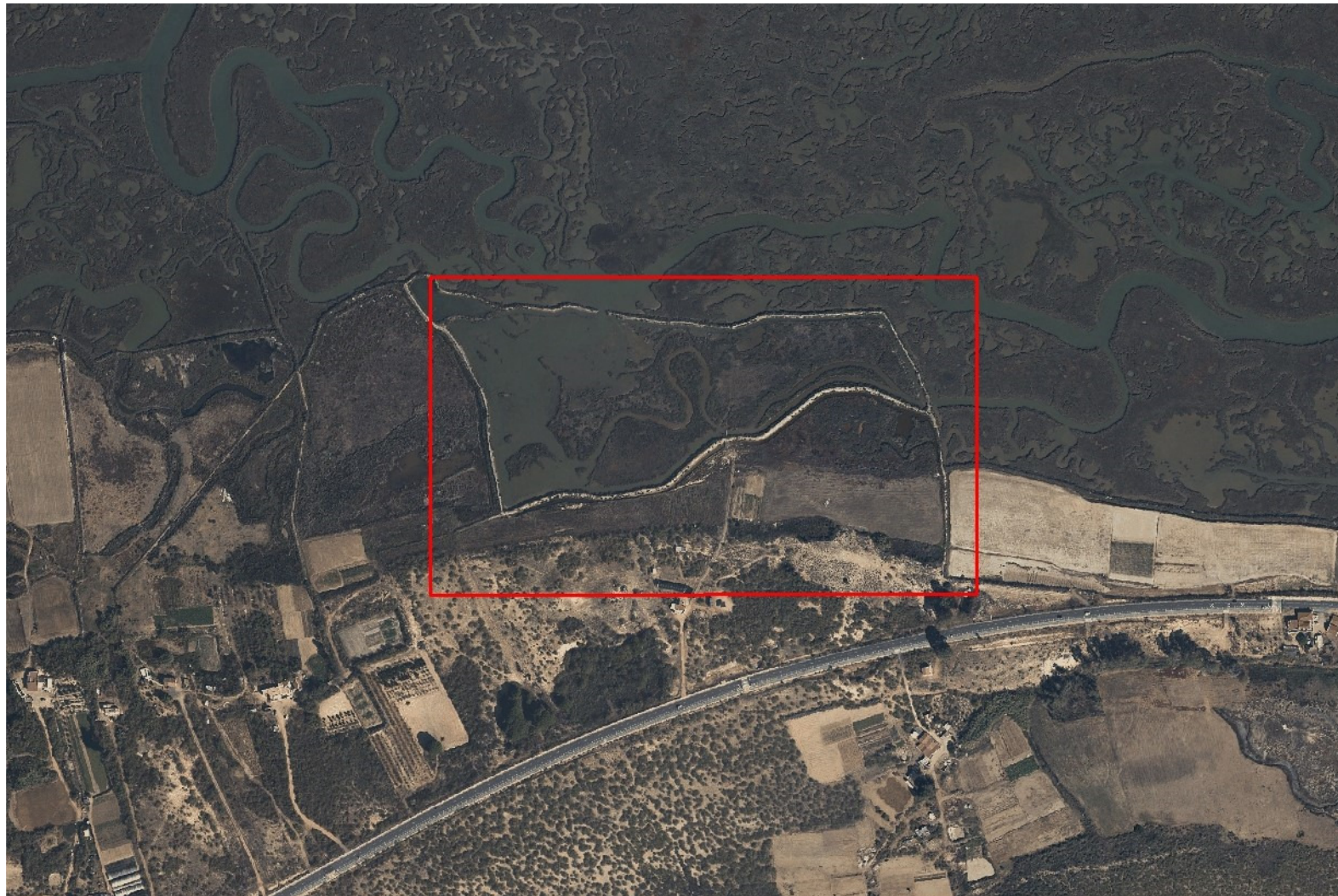
Ortofoto de la Junta de Andalucía de 2020, zona de estudio en recuadro rojo.