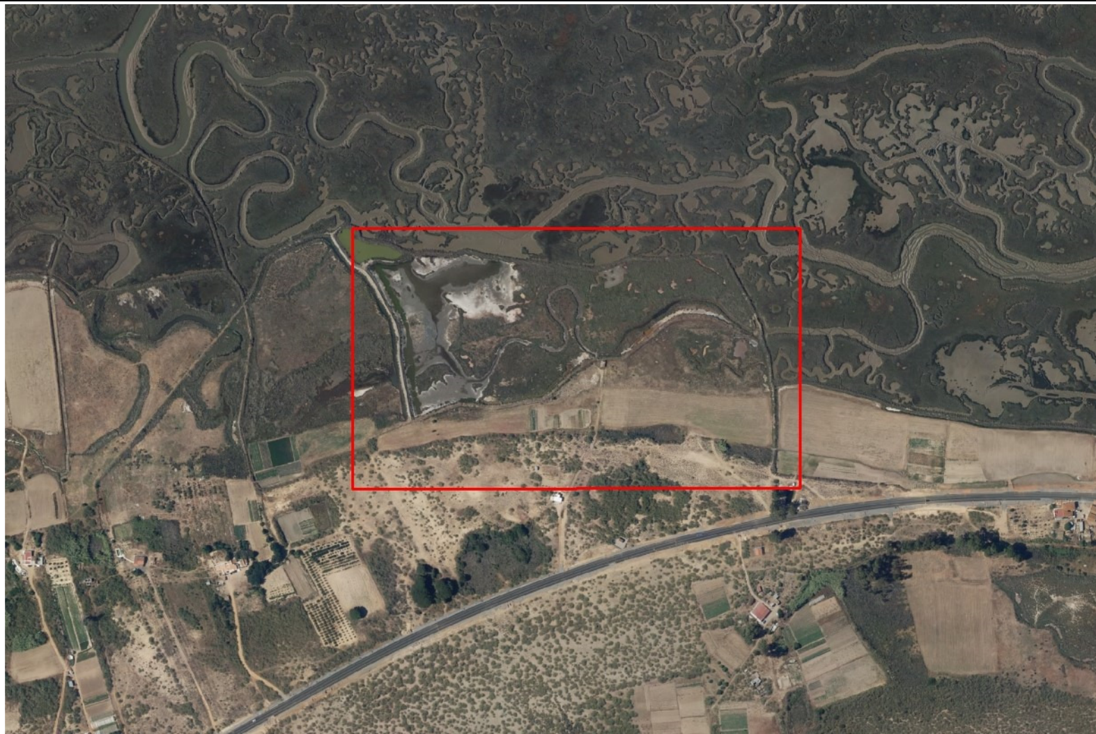
Ortofoto del vuelo del PNOA de 2016, zona de estudio en recuadro rojo.