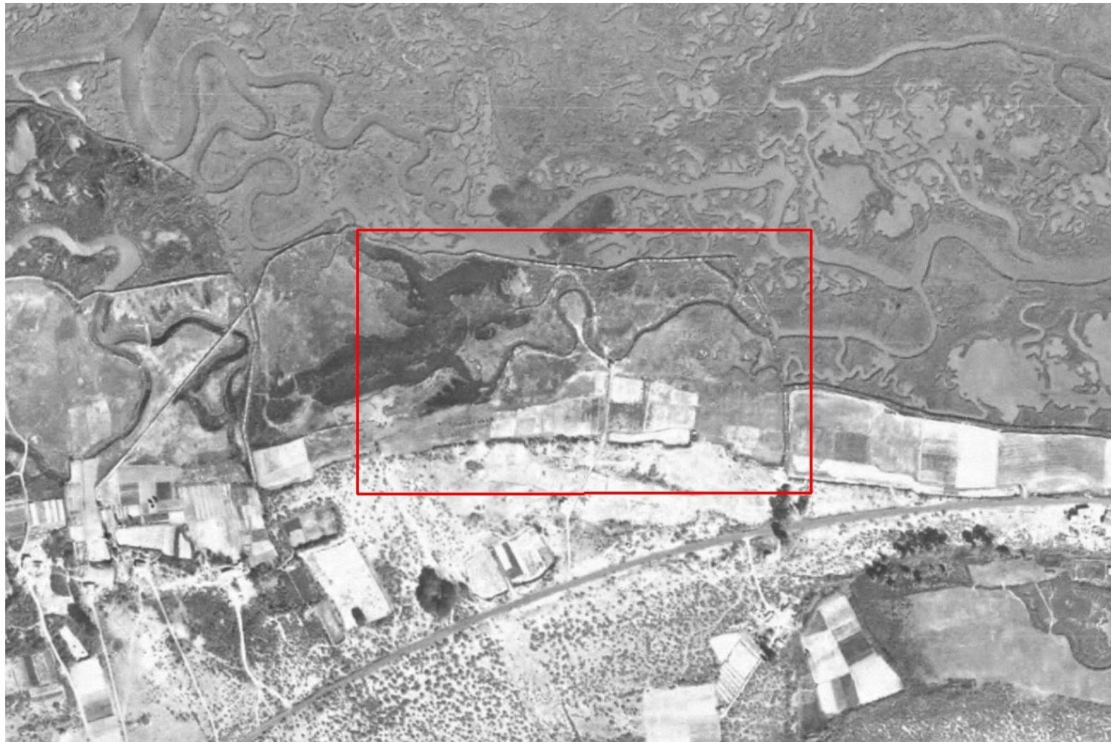
Ortofoto del vuelo del Olistat de 1997-1998, zona de estudio en recuadro rojo.