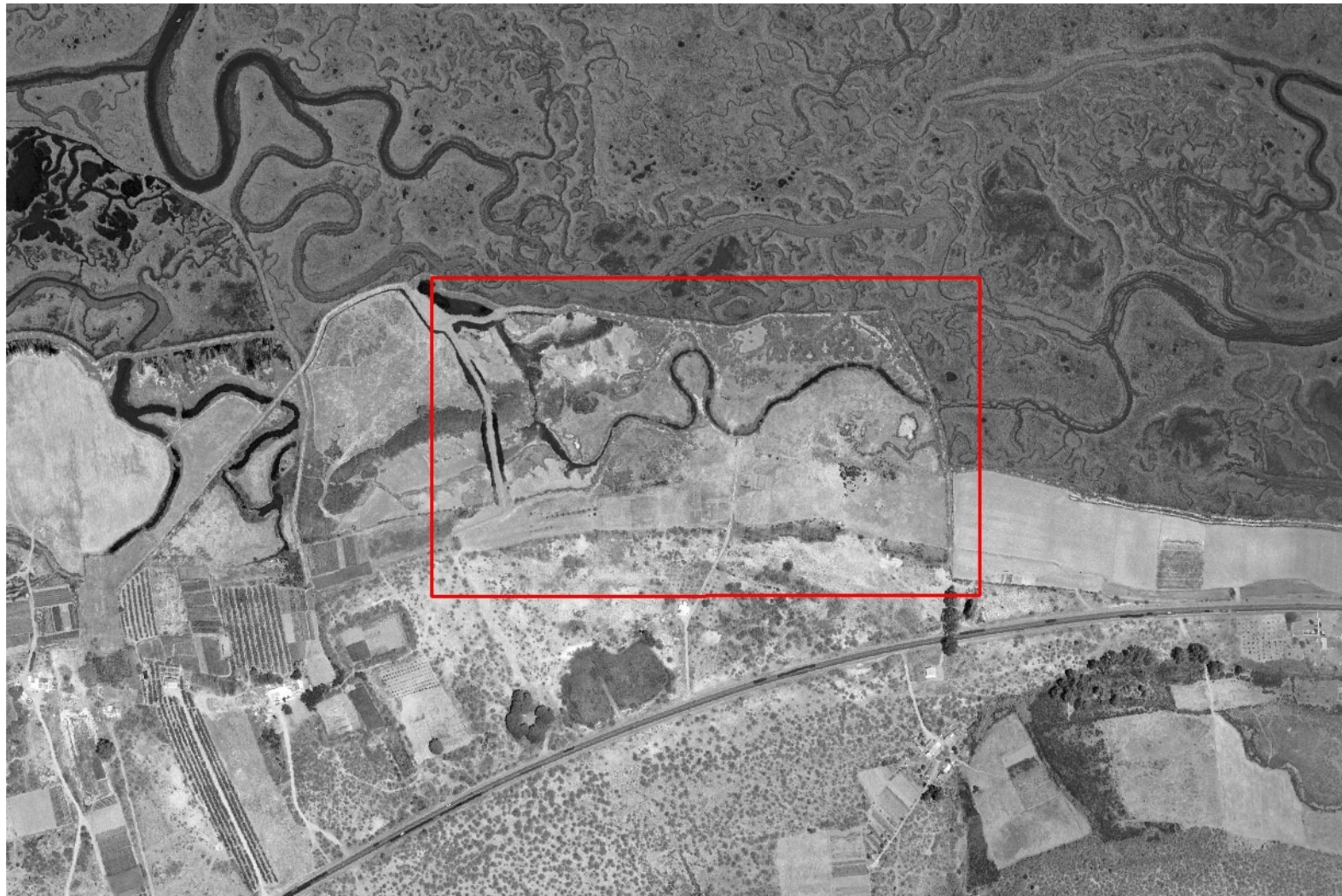
Ortofoto de la Junta de Andalucía de 2001, zona de estudio en recuadro rojo.