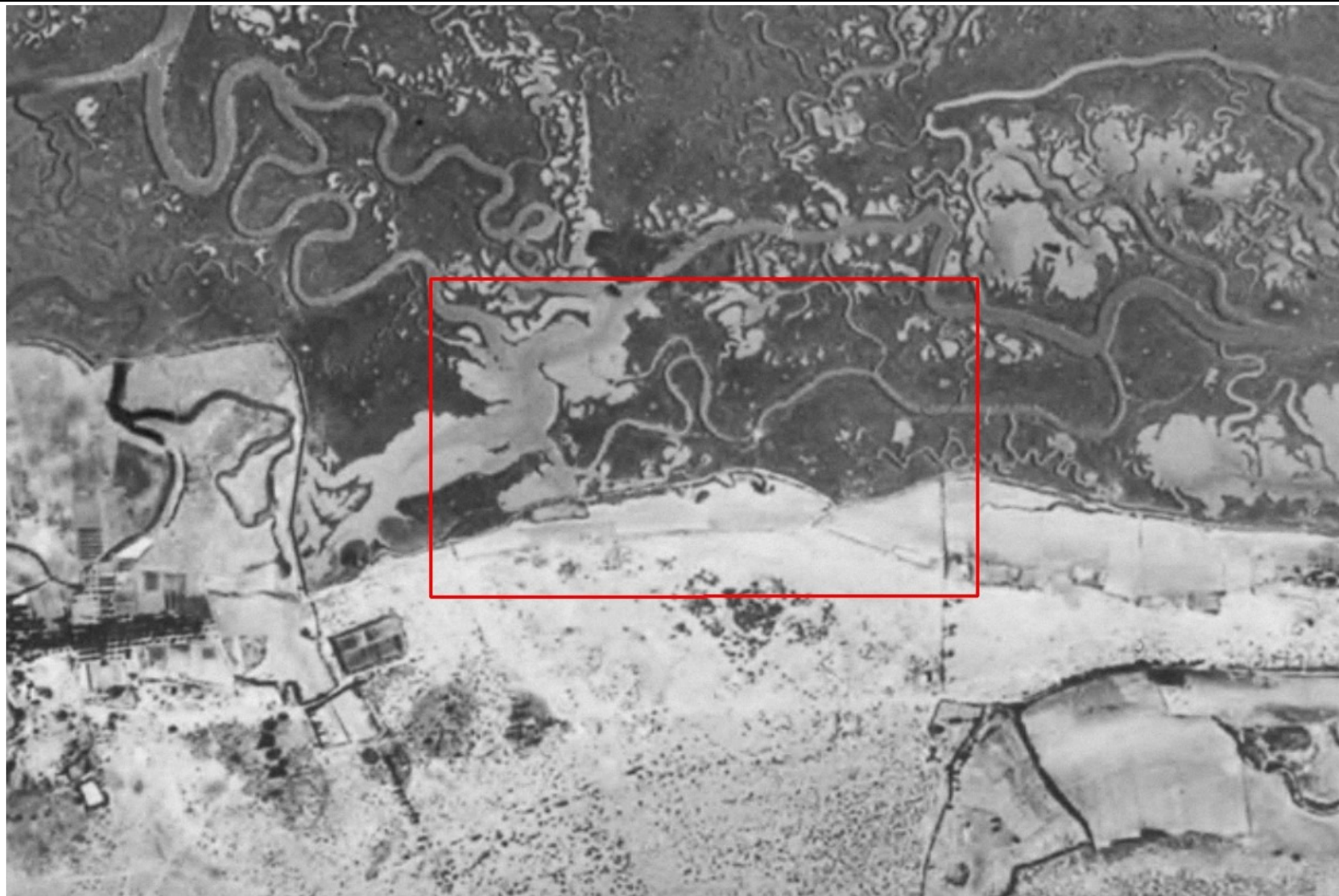
Ortofoto del vuelo americano de 1956, zona de estudio en recuadro rojo.