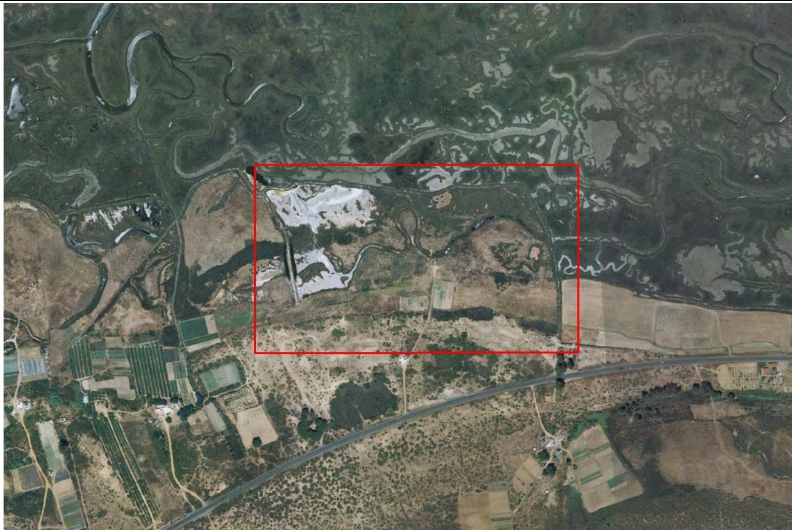
Ortofoto del vuelo del PNOA de 2007, zona de estudio en recuadro rojo.