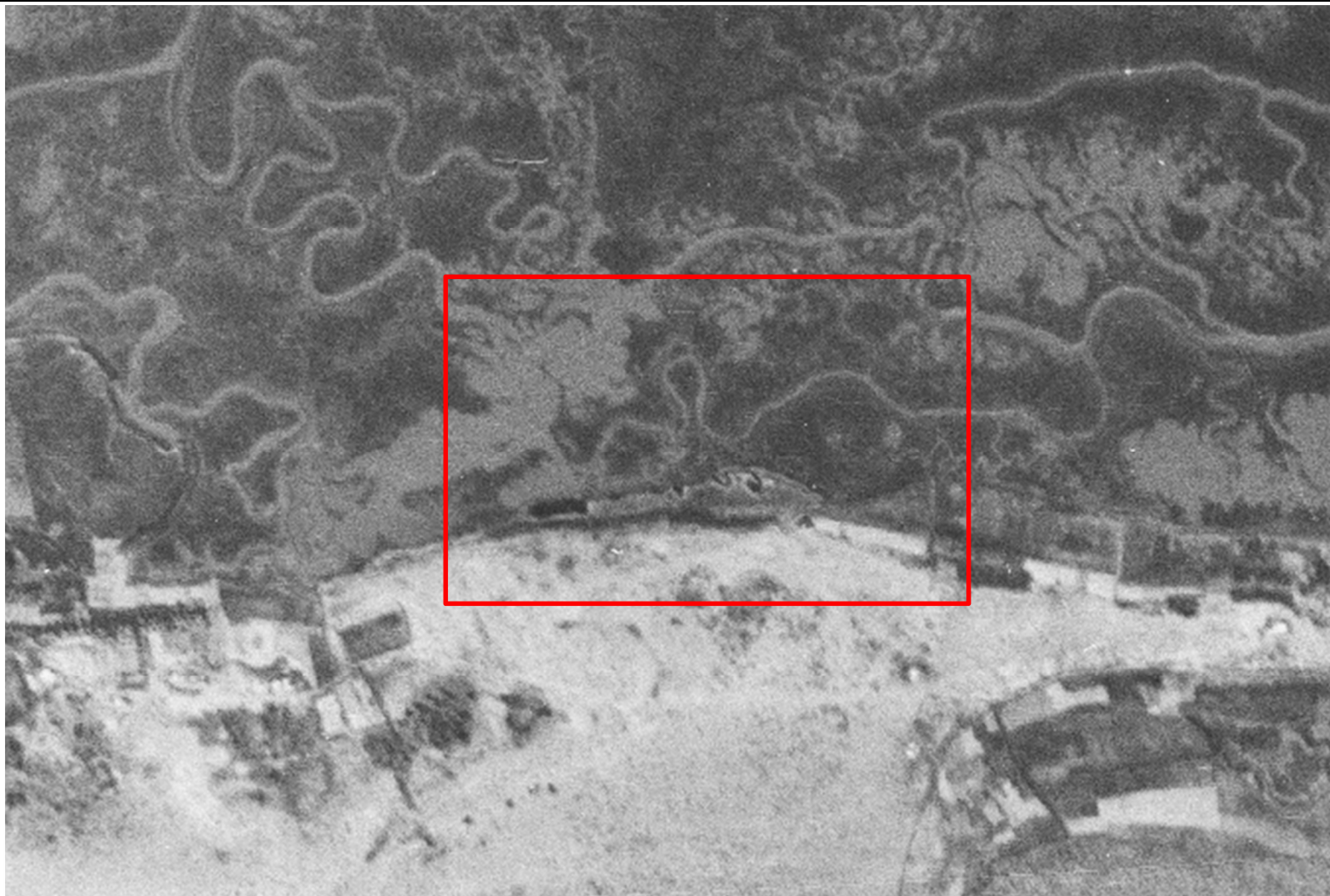
Fotograma del IGN del vuelo americano de 1946, zona de estudio en recuadro rojo.