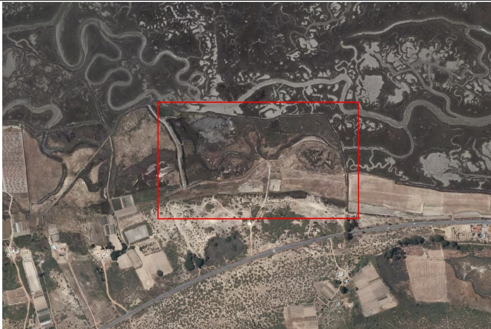
Ortofoto del vuelo del PNOA de 2013, zona de estudio en recuadro rojo.