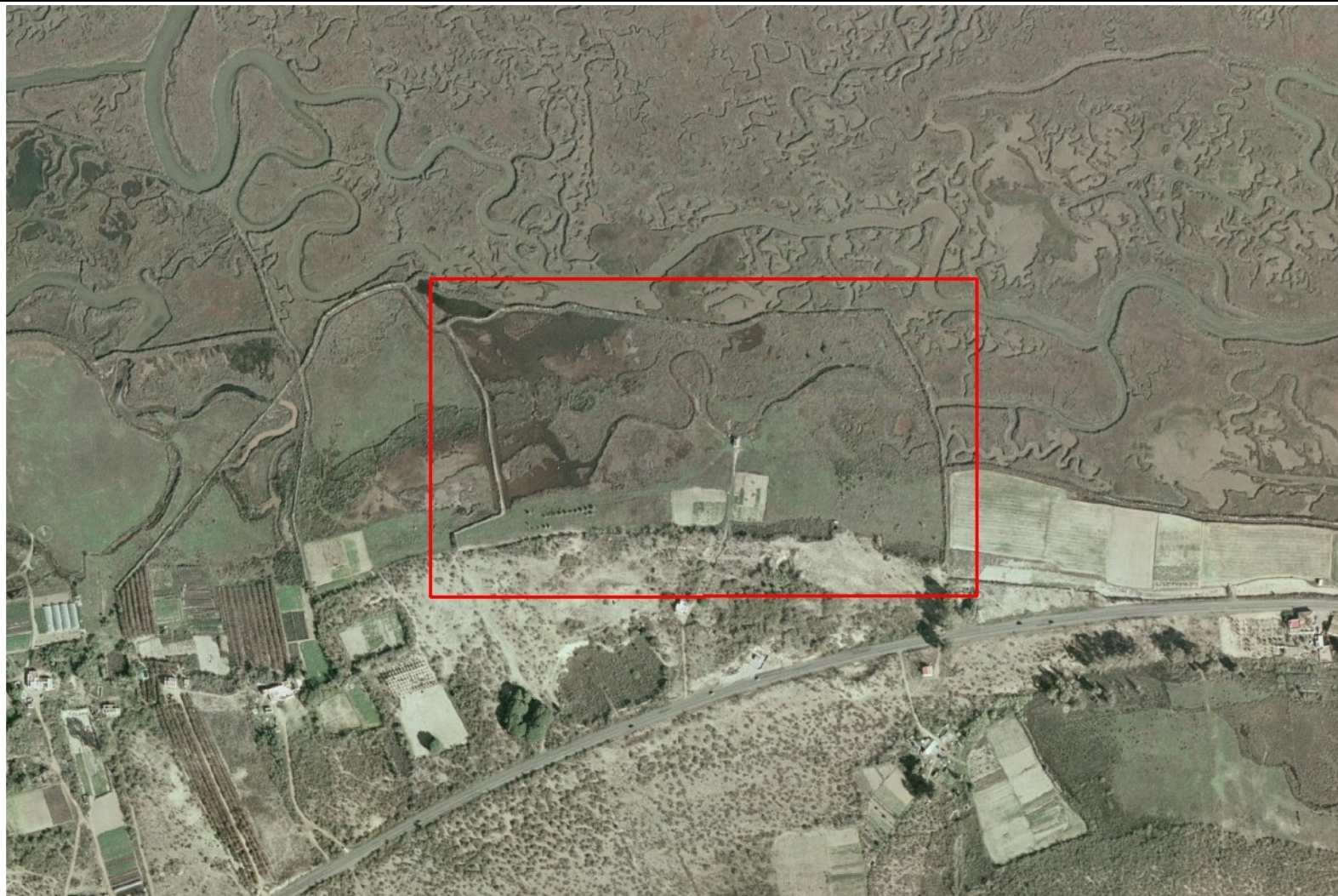
Ortofoto del vuelo del PNOA de 2005, zona de estudio en recuadro rojo.