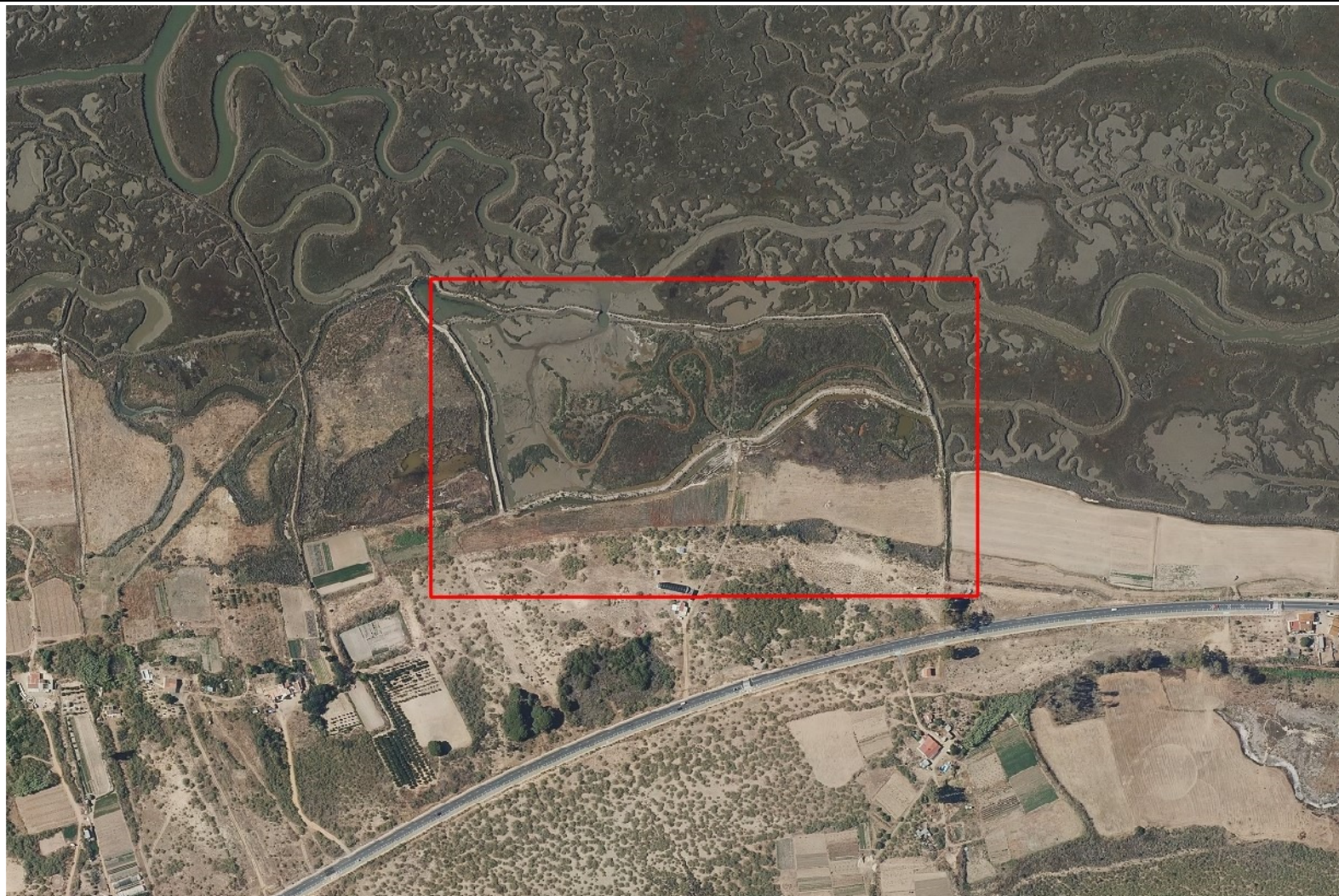
Ortofoto del vuelo del PNOA de 2019, zona de estudio en recuadro rojo.