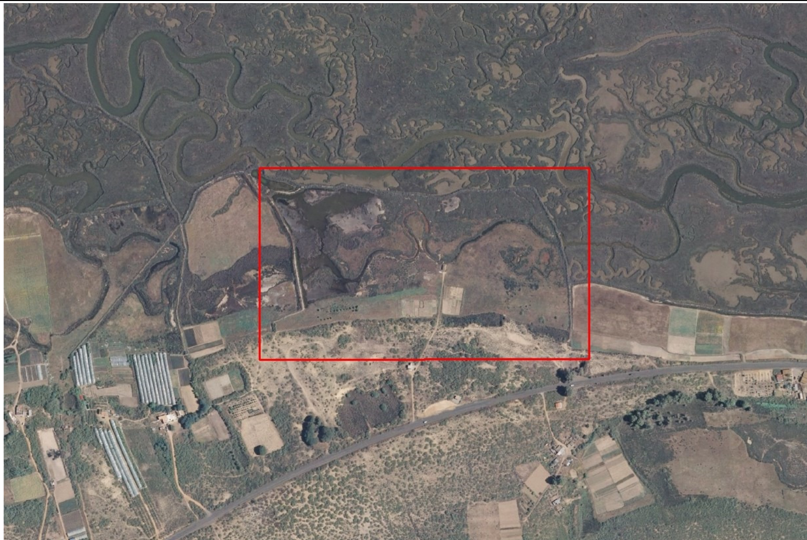
Ortofoto del vuelo del PNOA de 2009, zona de estudio en recuadro rojo.