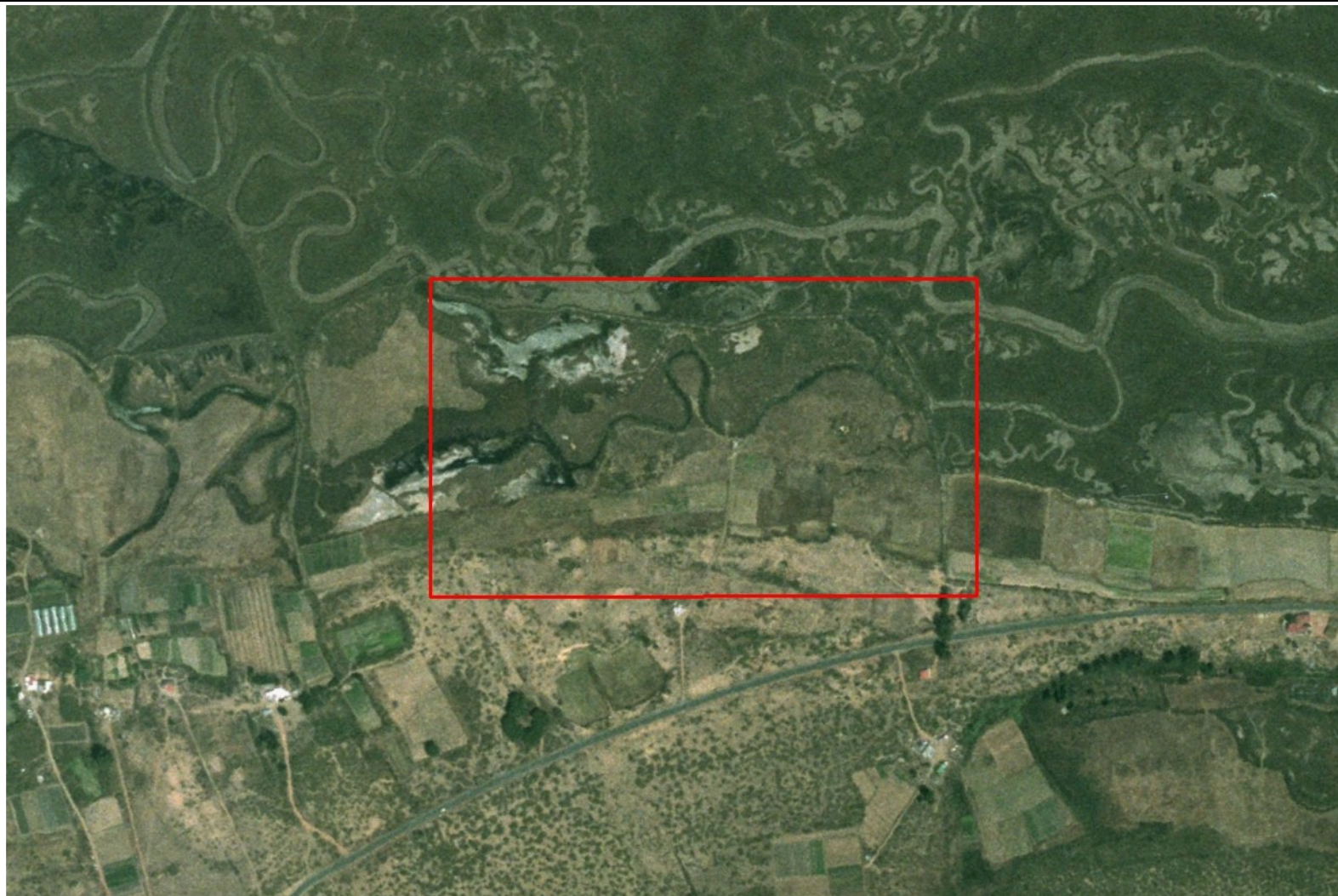
Ortofoto de la Junta de Andalucía de 1999, zona de estudio en recuadro rojo.