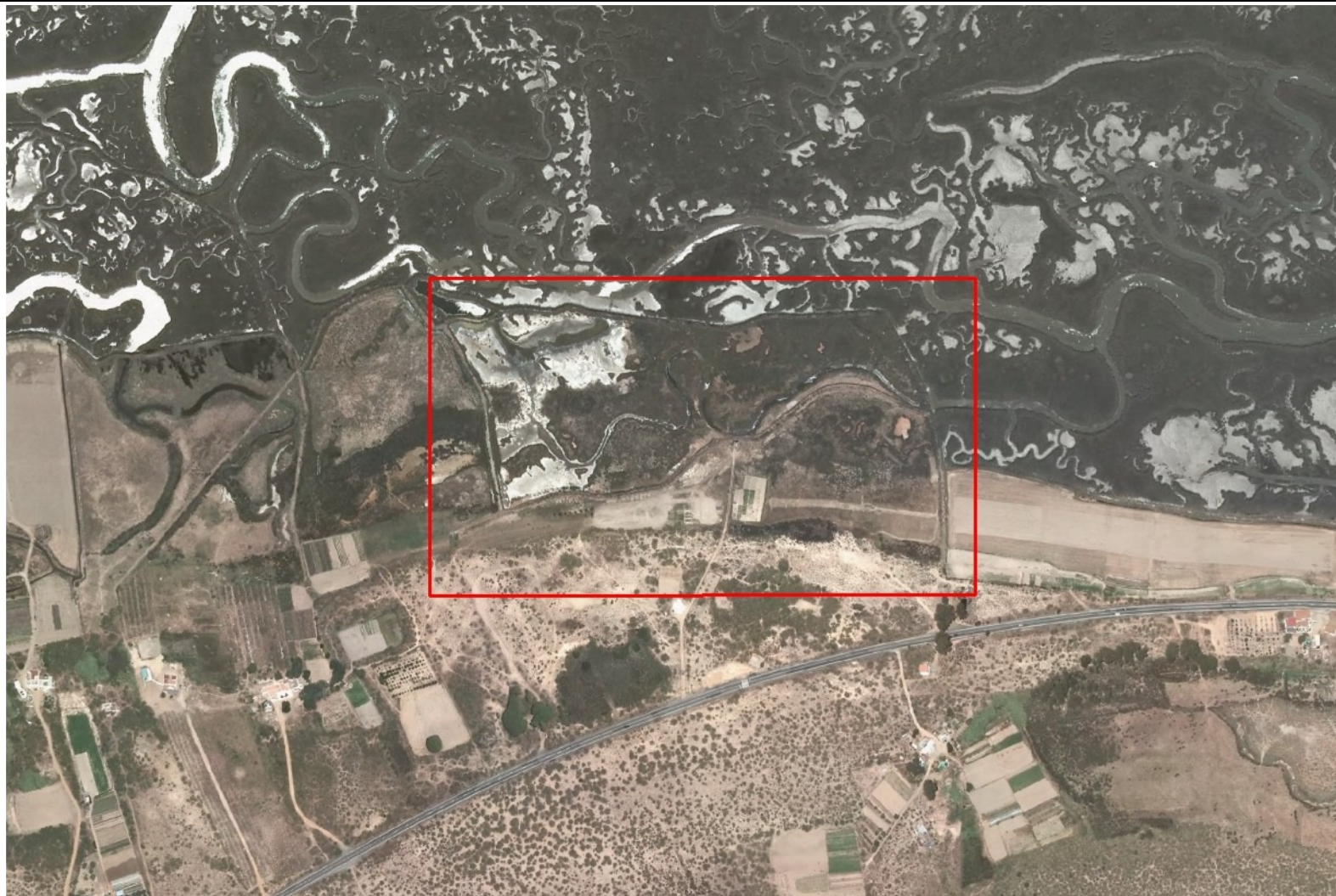
Ortofoto del vuelo del PNOA de 2011, zona de estudio en recuadro rojo.